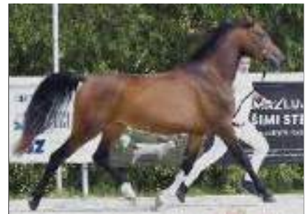
Tamina al Samarra, 2023, DE-Rotenburg. By Kosmos al Samarra, 2016, DE-Rotenburg. Out of Tigris al Samarra, 2015, DE-Rotenburg.

The Delegates' Meeting of the International Shagya Arabian Society (ISG) 2026 will take place on Friday, May 15, 2026, as part of the Arabian Horse Festival 2026 in Bábolna.