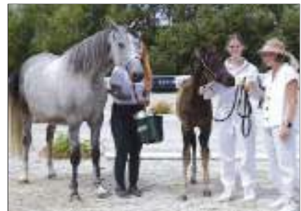
Taufe von Hengstfohlen Phenomen Afas, von Kuhailan Afas I-CZ Orkán, aus der Kuhailan Afas I-CZ Orkán.