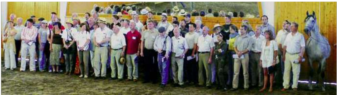
Erkennen Sie sich wieder? Das war am Beurteilungslehrgang in Bábolna vom 14. bis 16. Juli 2006.