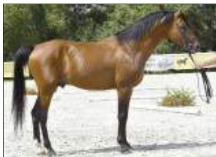
Reserve Champion ältere Hegste. 6652 Kemir IX Kemir VII-4. Von 4555 Kemir VII (Báb) Kemir V-5, 1997, Bábolna. Aus der 294 O'Bajan XXVIII, O'Bajan Basa-3, 2008, Bábolna