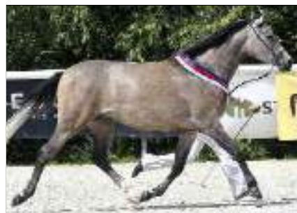
Jugenchampion ein-, zwei-, und dreijährige Stuten, Klassen 1, 3 und 5. O'Bajan VIII-3, 2022, CZ-Dubá. Von 3926 O'Bajan XXIV (Báb) 3926 O'Bajan IV (SK) 3148 O'Bajan VIII (CZ), 1997, Bábolna. Aus der Gazal XXI-1, 2017, CZ-Dubá