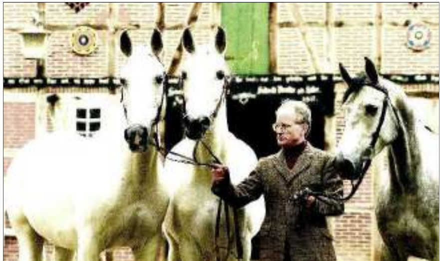
Von links: Grossmutter, Siglavy Bagdady-37, 1972, Topolcianky, von Siglavy Bagdady (Top) aus der 122 Dahoman IX-3. Mutter, Tadmor, 1980, DE-Schöllkrippen, von Shagya XXXIX-11 aus der Siglavy Bagdady-37. Tochter, Taese, 1985, DE-Schöllkrippen von Grande Arab, aus der Tadmor.