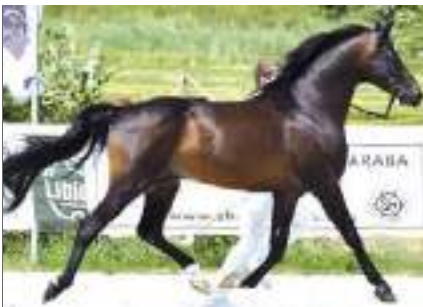
O'Bajan Gondolat, O'Bajan XXXIV (Báb), 2009, HU-Kaposvar. By 3926 O'Bajan XXIV, 1997, Bábolna. Out of 1890 Shagya Gina (H), 1996, Kaposvar.

The complete pedigrees of all horses listed in this article (on pages 15, 16 and 17) can be found at www.shagyadata.ch .