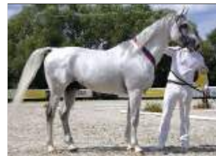
Champion ältere 4-6-, 7-10-, und 11-jährige und ältere Hengste, Klassen 8, 10 und 12. 6821 Shagya Zahir 121 Shagya XXXVII (Top), 2017, HU-Özd. Von 3128 Shagya II-13, 1992, Bábolna. Aus der El Sbaa Szolgáló, 2012, HU-Rudabánya