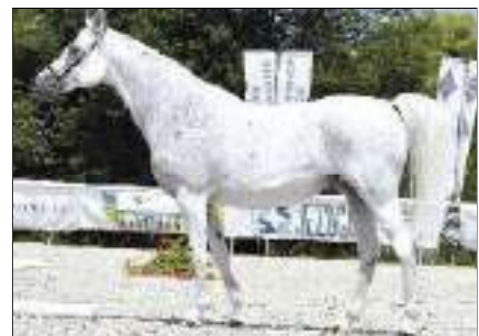
Reserve Champion ältere Stuten. Koheilan Rubin, 2014, HU-Nagyberki. Von 3029 Koheilan-49 Kenitra (H) Izsófalva Koheilan-49, 1992, HU-Izsófalva. Aus der Shagya Rezeda, 2003, HU-Kaposvar.