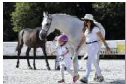
Tapfer führt das kleine Mädchen in der Kinderklasse ihren Wallach vor. Er wird in der Distanzreiterei eingesetzt.