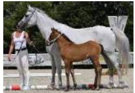
Jussuf-329 Josefa, 2013, AT-Baden. Von Joshua, 1556 Jussuf III-CZ, 1988. Aus der Shagya-879 Farah-879 (A), 1992. Mit Hengstfohlen Hâris Al Farid von Saklawi IX-CZ.