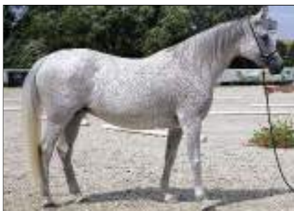
Champion ältere 4-6-, 7-10-, und 11jährige und ältere Stuten, Klassen 8, 10 und 12. Gazal XXI-1, 2017, CZ-Dubá. Von 4965 Gazal XXI (Báb) Gazal XIX-5, 2003, Bábolna. Aus der O'Bajan XVIII-7 Basra (H), 1993, Bábolna.