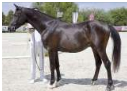
Jugenchampion ein-, zwei- und dreijährige Hengste, Klassen 2, 4 und 6. Gazal Oreo, 2023, HU-Rudabánya. Von 7138 Gazal Golyó 4673 Gazal XI (SK) 2530 Gazal VI (CZ), 2006, HU-Mocsa. Mutter: Koheilan Leila, 2009, HU-Rudabánya.