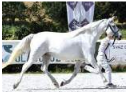
Kapriola, 2019, CZ-Horice v Podkrkonoši. By 925 Koheilan VII (CZ) Drak, 1997, CZ-Horice bv Podkrkonoši. Out of Kapka, 2002, CZ-Horice v Podkrkonoši.